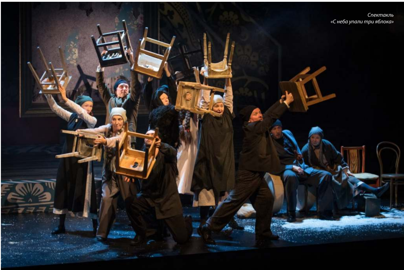
Спектакль «С неба упали три яблока»

Давно знакомый иркутянам Минусинский драмтеатр под руководством заслуженного деятеля искусств Алексея Песегова познакомит нас с постановкой своего лидера по рассказу Мамина-Сибиряка «Озор». Спектакль называется «Озорник» - почти легкомысленно. Но мы уже знаем: и от прозаика - крепкого знатока могучих сибирских характеров, и от минусинского вдумчивого режиссёра следует ждать глубокой и проникновенной истории.