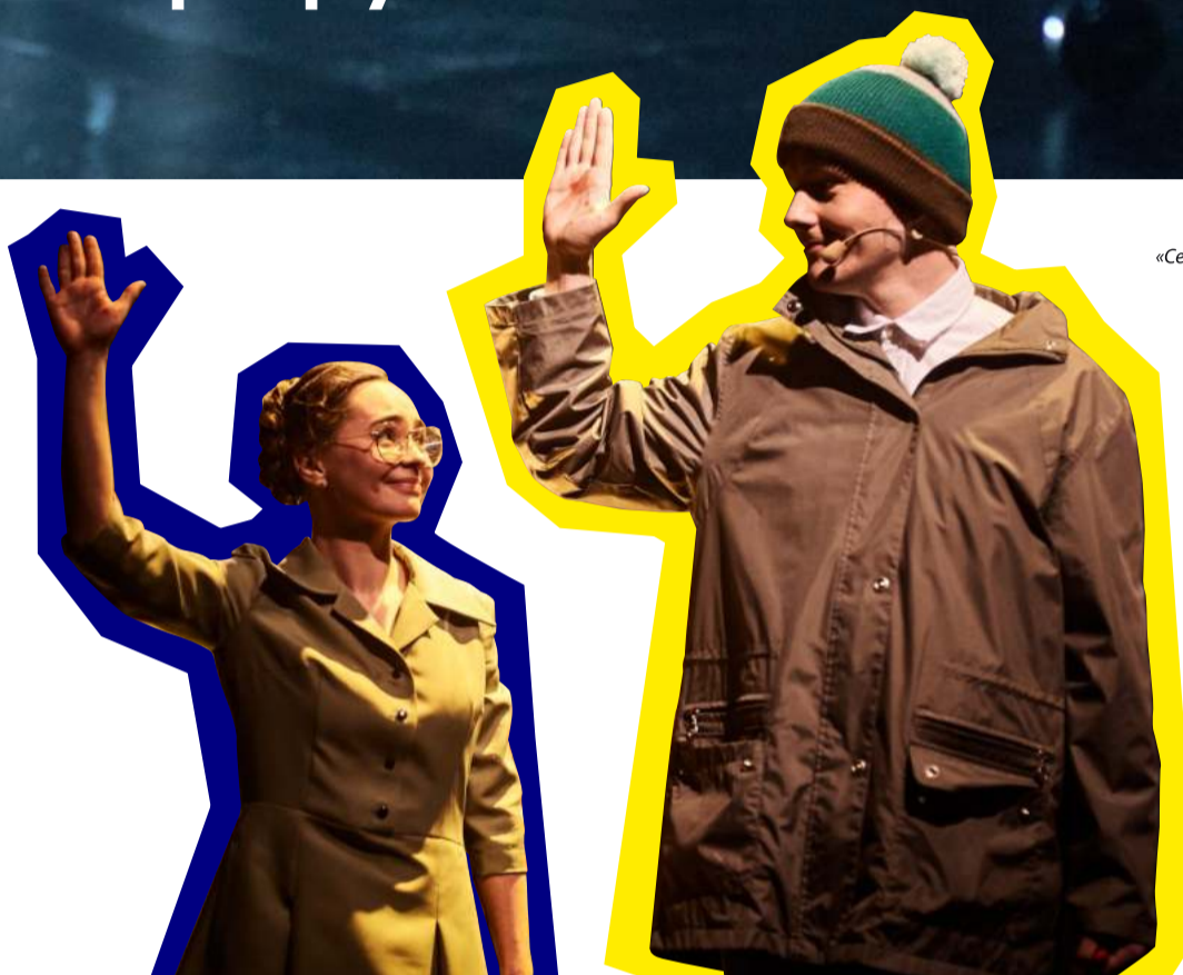
Спектакль «Семью восемь»