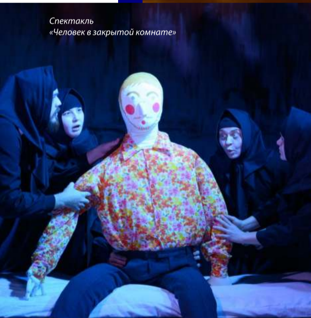
Спектакль «Человек в закрытой комнате»