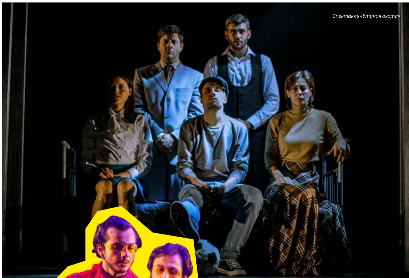
Спектакль «Утиная охота»

Встречу с ещё одним классическим произведением готовят зрителю гости из Абхазии. Государственный русский театр им. Фазила Искандера приглашает нас к «путешествию в неизведанное в 3 актах» с культовым названием «Солярис». Инсценировка близка к тексту Станислава Лема и далека от легендарного фильма Тарковского. Трёхчасовое действие с двумя антрактами поднимает серьёзные экзистенциальные вопросы, диагностирует глубинные психологические кризисы, завораживает небывалой визуальной красотой.