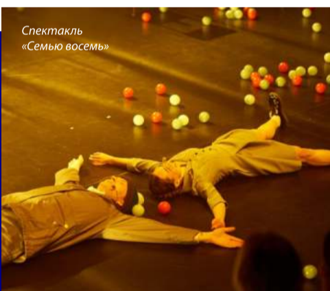
Спектакль «Семью восемь»