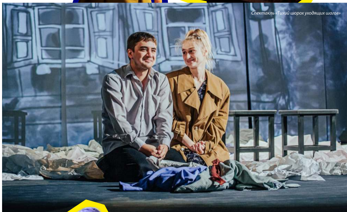
Спектакль «Тихий шорох уходящих шагов»