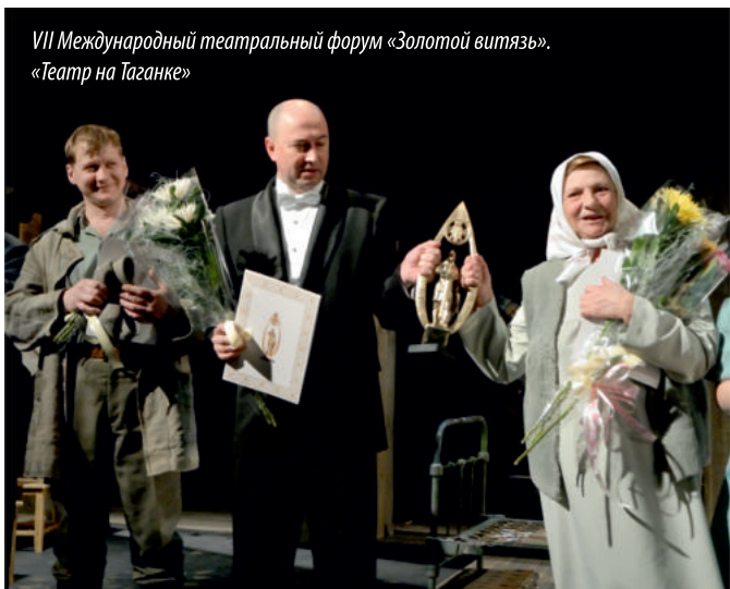
VII Международный театральный форум «Золотой витязь». «Театр на Таганке»