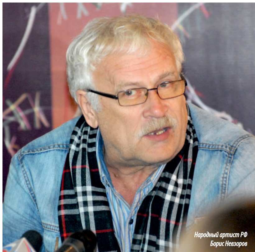
Народный артист РФ Борис Невзоров