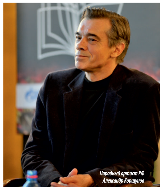
Народный артист РФ Александр Коршунов