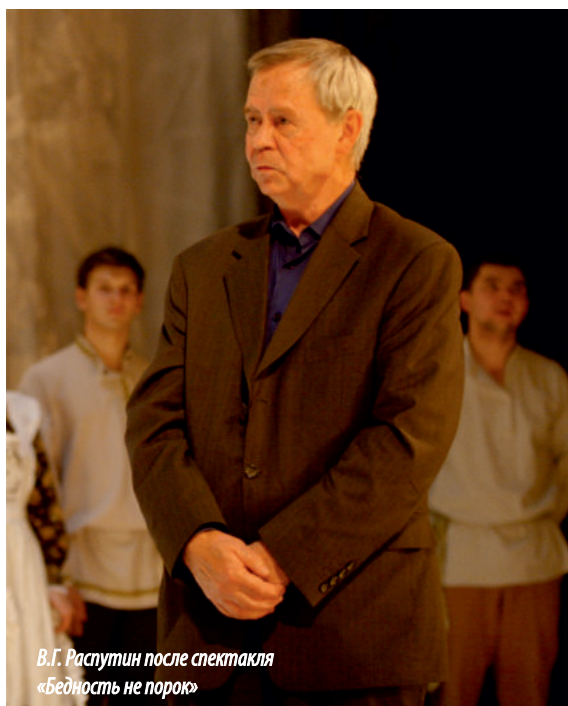
В.Г. Распутин после спектакля «Бедность не порок»