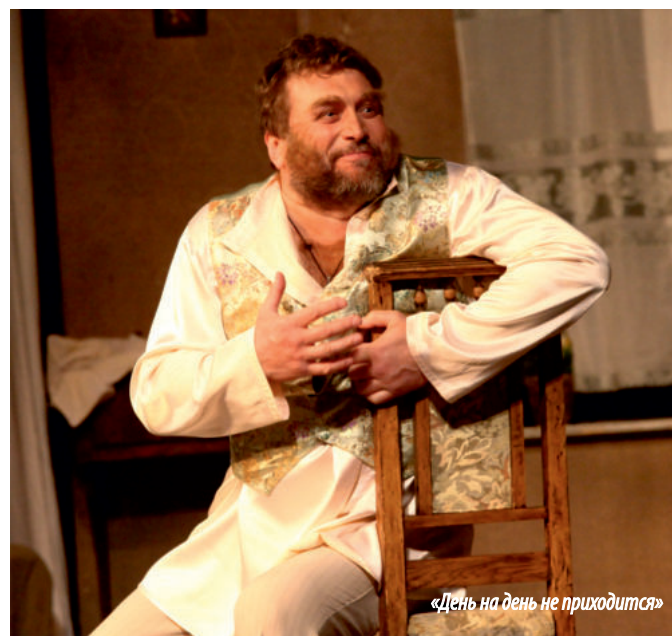
«День на день не приходится»