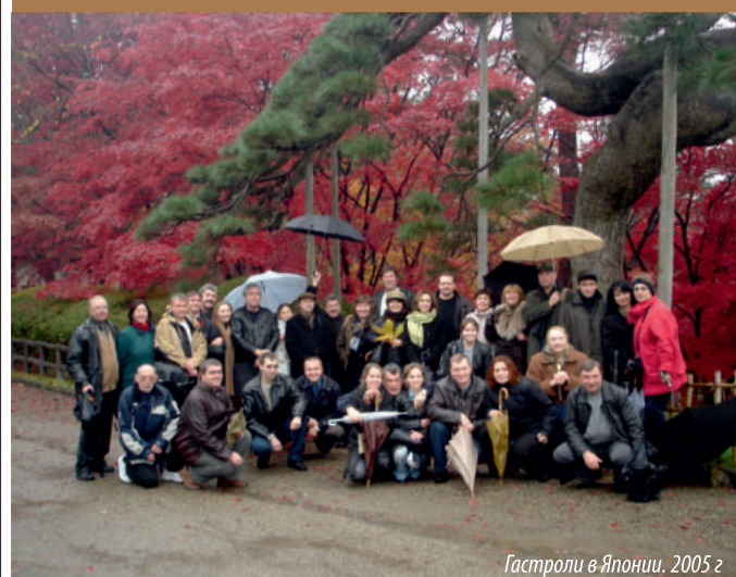
Гастроли в Японии. 2005 г.

Иркутский академический ведёт обширную гастрольную деятельность. Актёрам Театра драмы рукоплескали зрители не только Иркутска и области, но и Омска, Томска, Новороссийска, Санкт-Петербурга, Душанбе, Баку, Фрунзе, Москвы, Симферополя, Петропавловска-Камчатского, Ростова-на-Дону, Воронежа, Сочи, Киева, Одессы, Барнаула и многих других городов.