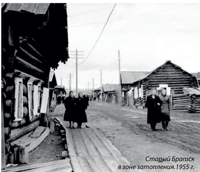
Старый Братск в зоне затопления. 1955 г.

Ехал театр от Матёры, канувшей под воду, к Матёре будущей, сценической, понимая, какой ответственной станет грядущая премьера.