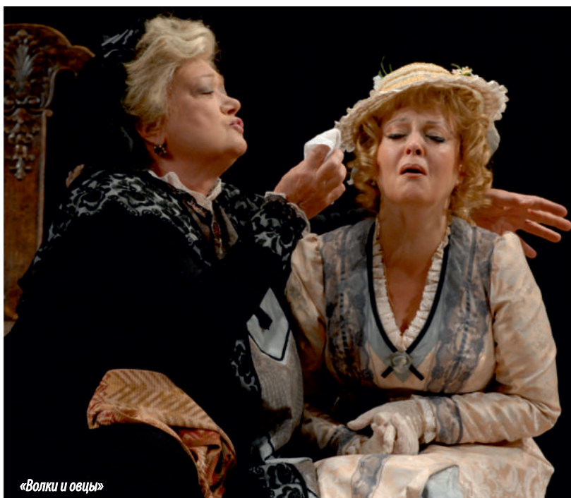
«Волки и овцы»