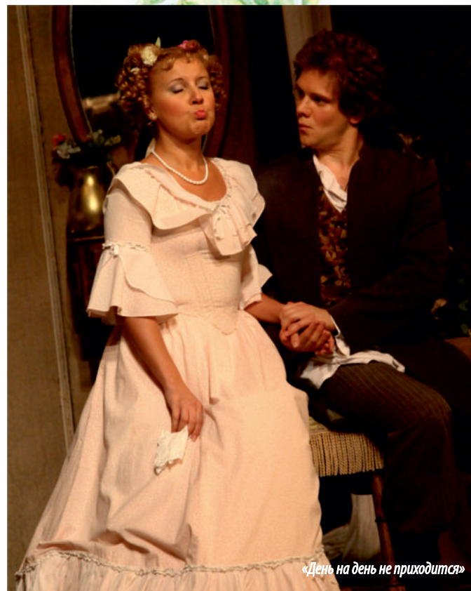
«День на день не приходится»