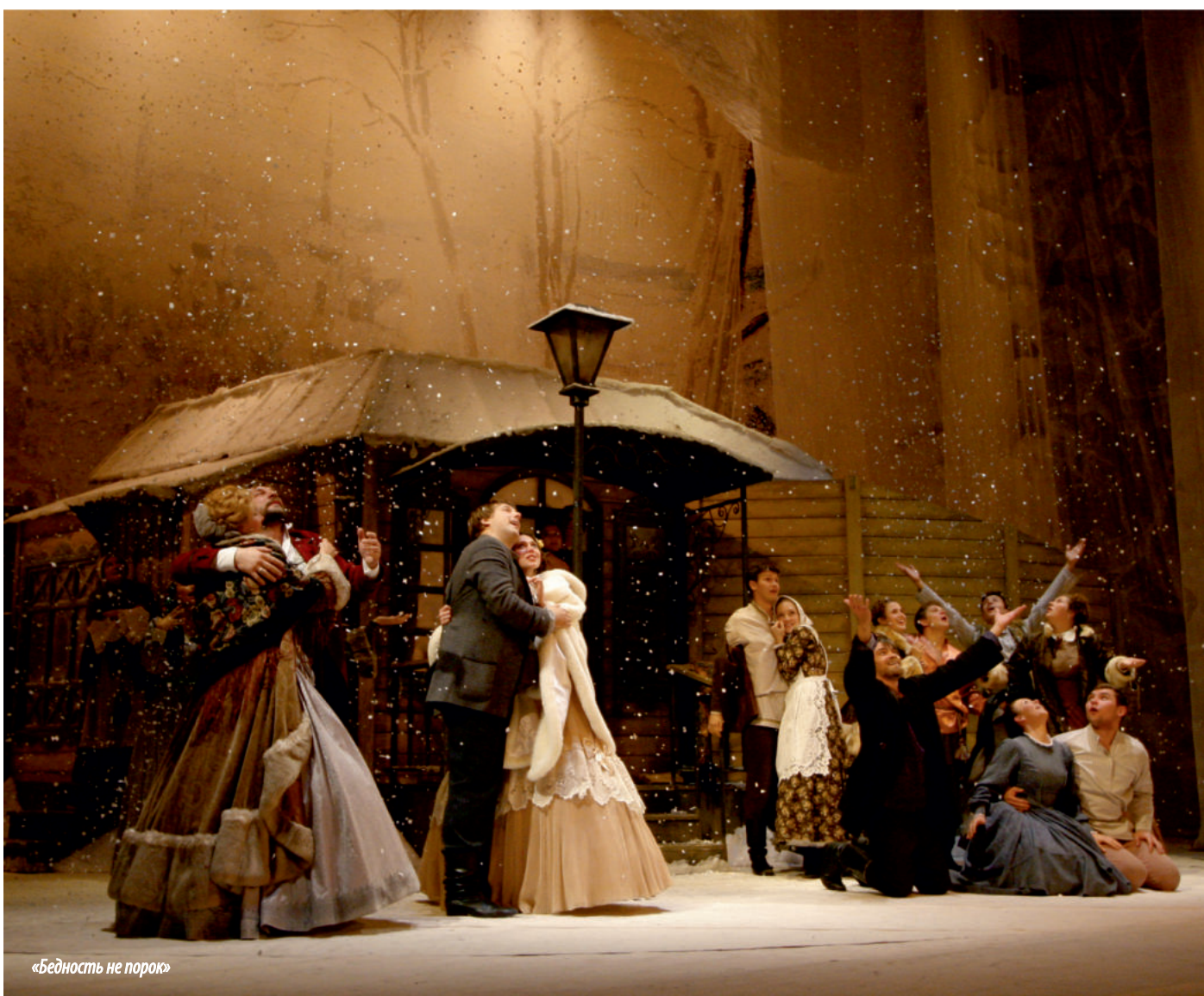
«Бедность не порок»