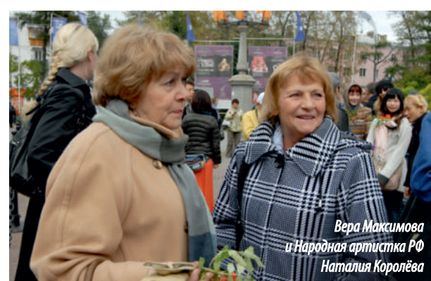
Вера Максимова и Народная артистка РФ Наталья Королёва