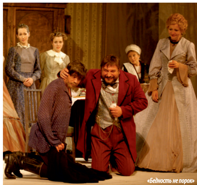
«Бедность не порок»